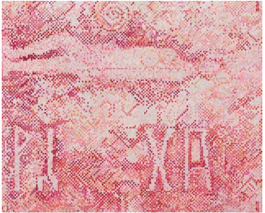
Tour de Madame 4 , 2018 Courtesy Galerie Buchholz, Cologne/Berlin/New York © Jutta Koether