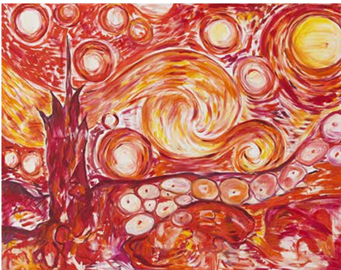
Starry Night II , 1988 Courtesy the artist and Galerie Buchholz, Cologne/Berlin/New York © Jutta Koether