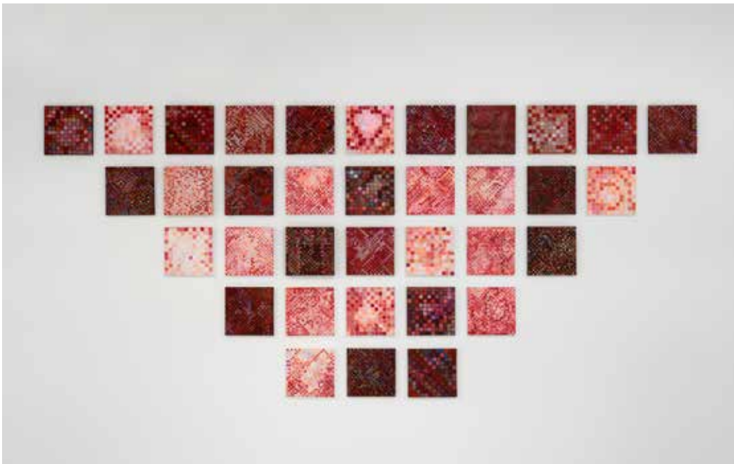
Berlin Boogie (Bruised Grid #7) , 2016 Collection Mudam Luxembourg – Musée d'Art Moderne Grand-Duc Jean Acquisition 2018